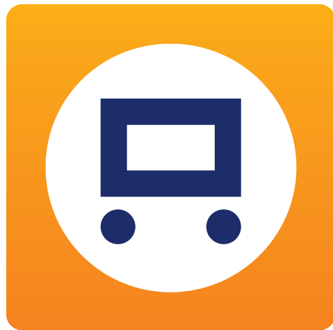
Versión full color variante vertical

La variante vertical sólo será usada exclusivamente en ocasiones donde la marca se vea forzada a presentarse en un contenedor estrecho o de proporciones verticales.