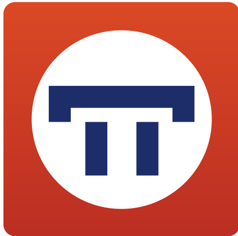
Versión full color variante vertical

La variante vertical sólo será usada exclusivamente en ocasiones donde la marca se vea forzada a presentarse en un contenedor estrecho o de proporciones verticales.